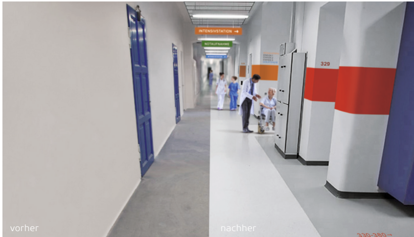
Perfekte Optik von Parkett und Holzböden mit den Produkten der Master Serie