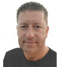
Dennis Reipsch Hopper Design

🗨️ REIPSCH: Neu ist unser Online Shop für Pflegeprodukte. So binden wir unsere Kunden und liefern einen nachhaltigen Mehrwert.