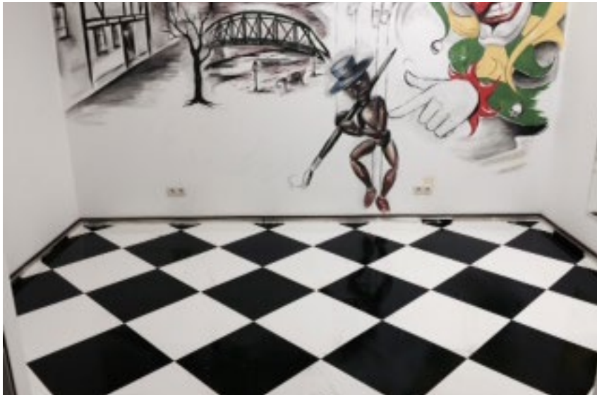
Der neue Arbeitsbereich im Tattoo Studio Joker Tattoo in Magdeburg