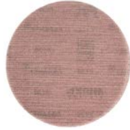
Abranet Ace 406/150mm 80er, 120er und 150er K