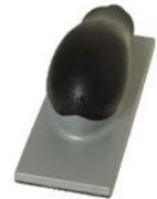
Handblock m. Absaugung 70x198mm