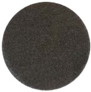
High Performance Pad schwarz 410mm