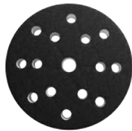
Interface Pad 410 / 150 mm